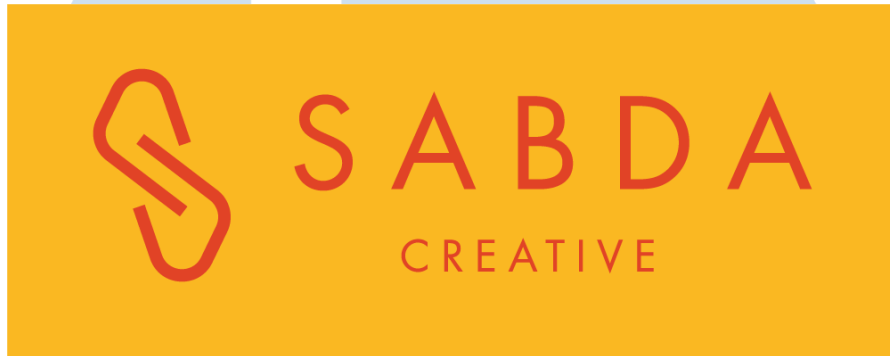
Gambar 2. 1 Logo Sabda Kreasi Nusantara