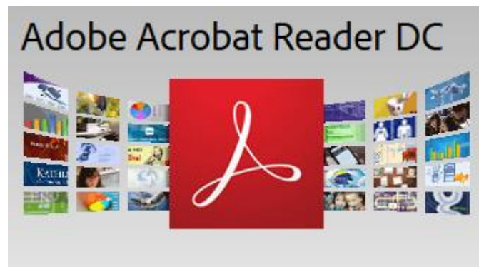
Gambar 3.2. Adobe Acrobat Reader