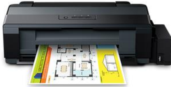
Gambar 3.5.2. Epson L1300