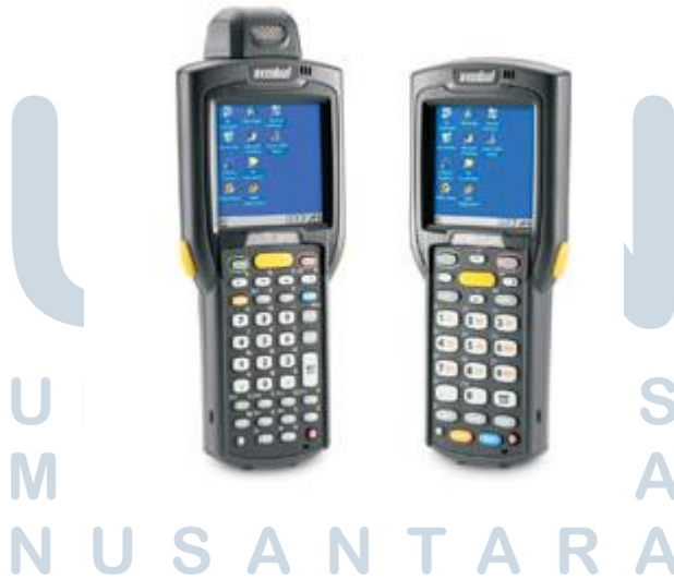
Gambar 3.6. Motorola MC3000

Motorola MC3000 merupakan sebuah prengkat yang digunakan untuk menscan barcode, dan sering digunakan untuk melakukan kegiatan stock take pada supermarket atau warehouse .