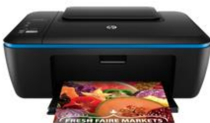
Gambar 3.5.1. Hp Deskjet 2529

Printer yang digunakan untuk mencetak dokumen dan juga memiliki fungsi untuk menscan gambar juga untuk menyalin gambar. Ada beberapa jenis printer yang digunakan, dua diantaranya adalah Hp Deskjet 2529 dan Epson L1300.