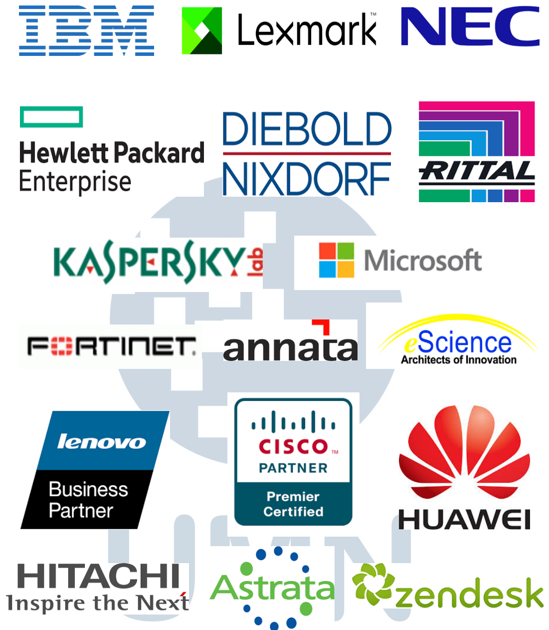
Gambar 2.3 Logo-logo mitra kerja PT Intikom Berlian Mustika [2]