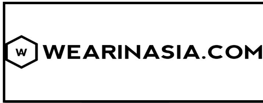
Gambar 2.1 Logo dari WEARINASIA