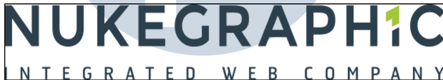
Gambar 2.1 Logo CV Nukegraphic Indonesia (Nukegraphic Indonesia, 2012)