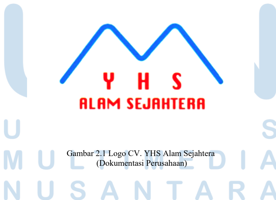
Gambar 2.1 Logo CV. YHS Alam Sejahtera

CV. YHS ALAM SEJAHTERA adalah perusahaan yang bergerak di dalam bidang kontruksi, suplayer, jasa, perdagangan kecil sampai menengah dll. Arti dari nama YHS itu sendiri berasal dari nama-nama dalam keluarga sedangkan Alam sejahtera itu sendiri di lambangkan dalam bentuk 2 gunung yang menjadi logo perusahaan dimana perusahaan kami bisa membawa kesejahteraan buat keluarga khususnya kepada masyarakat dan lingkungan umumnya. CV. YHS ALAM SEJAHTERA berdiri dibulan Oktober 2012 dan di tahun 2013 sudah mulai beraktivitas dalam bidang kontruksi yang di bidangnya baik itu jalan, jembatan, gedung sekolah dan gedung lainnya juga di bidang SDA (sumber daya air) untuk pembangunan waduk, irigasi dan pintu DAM. Perusahaan kami sejak awal bekerjasama dengan pihak instansi pemerintahan seperti Dinas PU, Dinas Pendidikan dan Dinas Perhubungan. Ada beberapa pekerjaan yang kami menangkan dalam beberapa Tender umum setiap tahunnya maupun penunjukan langsung dari dinas terkait.