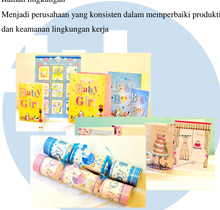
Gambar 2.1.2 Beberapa produk dari PT Cermat Makmur Abadi International