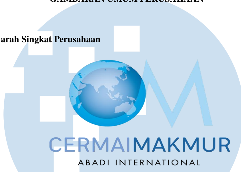
Gambar 2.1.1 Logo PT Cermat Makmur Abadi International