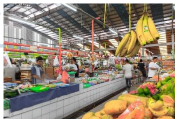
Gambar 2.1.1 Pasar Modern Sinpasa

Sebuah pasar tradisional yang dikemas dengan konsep modern yang berdiri di tanah seluas 4.000 m 2 diresmikan pada tanggal 23 September 2004 untuk memenuhi kebutuhan warga di kawasan Summarecon Serpong dan sekitarnya. Pasar Sinpasa ini dibangun dengan konsep yang sangat baik, mengacu pada standar pasar modern yang bersih dan aman. Pasar Sinpasa terdiri dari 142 pedagang dengan kategori kios dan lapak, yang menjual beragam jenis untuk memenuhi kebutuhan sandang, makanan, sembako, obat, bahkan perhiasan emas bagi masyarakat, khususnya di wilayah Summarecon Serpong dan sekitarnya.