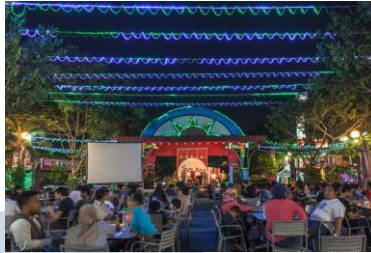
Gambar 2.1.1 Salsa Food City