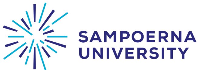
Gambar 2.4 Logo Sampoerna University