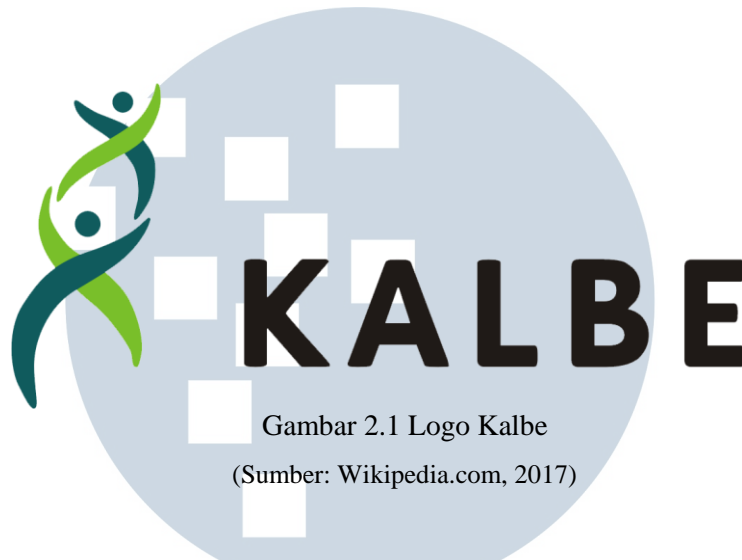
Gambar 2.1 Logo Kalbe

Menurut situs kalbe.co.id (diakses pada tanggal 12 Oktober 2017) Kalbe berdiri sejak tahun 1966 yang bermula dari garasi. Didirikan oleh Boenjamin Setiawan, Ph.D. dan 6 saudaranya, Kalbe berkembang menjadi Kalbe Group. Seiring dengan pertumbuhannya Kalbe berkembang pesat dari masa ke masa menjadi Perusahaan yang terbagi atas 4 kelompok usaha yaitu Obat Resep, Produk Kesehatan, Nutrisi, dan Distribusi & Logistik. Tetapi sampai sekarang, Kalbe tetap memegang prinsip dasar mereka yaitu inovasi, merek yang kuat, dan manajemen prima. Kalbe Panca Sradha merupakan pedoman nilai dasa bagi setiap karyawan yang membawa Kalbe meraih pertumbuhan yang statis dan menjadi perusahaan public pada tahun 1991 di Bursa Efek Indonesia.