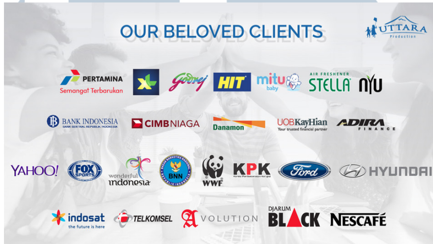
Gambar 2.3 Klien Utara Production

Portofolio tersebut merupakan hasil pengerjaan proyek dari beberapa perusahaan maupun instansi. Di bawah ini adalah sejumlah perusahaan dan instansi yang merupakan klien dari Utara Production: