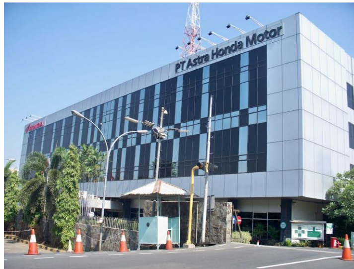
Gambar 2.1. Gedung Astra Motor