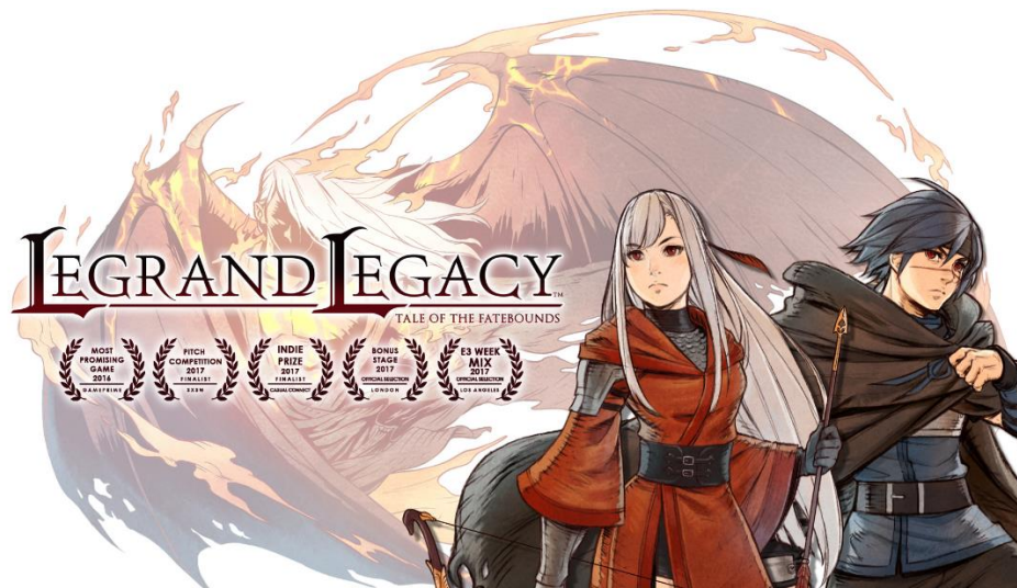
Gambar 2.2. "Legrand Legacy" ( www.legrandlegacy.com )

Game tersebut telah meraih beberapa penghargaan seperti: