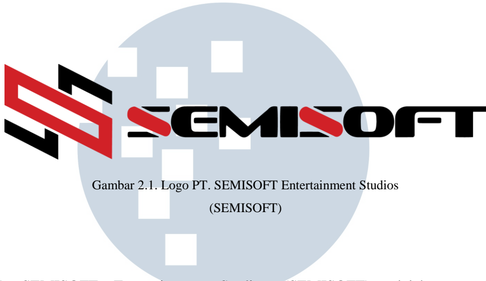
Gambar 2.1. Logo PT. SEMISOFT Entertainment Studios (SEMISOFT)