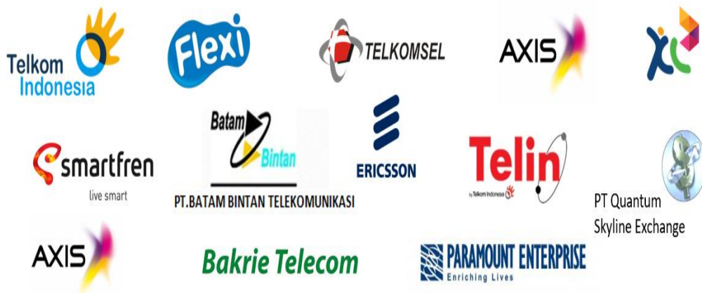
Gambar 2.2. Klien-Klien PT Indocode Technology

PT Indocode Technology telah menangani banyak sekali perusahaan terutama perusahaan telekomunikasi. Berikut adalah klien-klien yang telah bekerjasama dengan PT Indocode Technology: