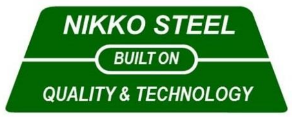
Gambar 2.1 Logo NikkoSteel