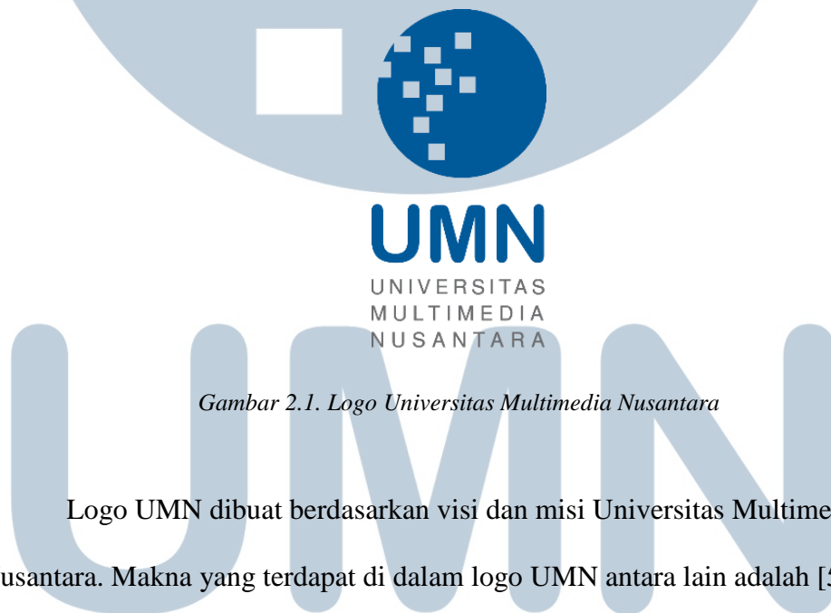
Gambar 2.1. Logo Universitas Multimedia Nusantara

Logo Universitas Multimedia Nusantara dapat dilihat pada Gambar 2.1.