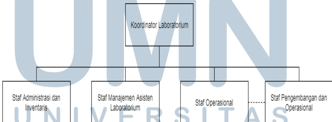
Gambar 2.3 Struktur Organisasi Laboratorium FTI

Koordinator Laboratorium FTI dibantu oleh beberapa staf Laboratorium yang menangani semua laboratorium didalam lingkup FTI. Praktek kerja magang yang dilakukan oleh penulis berada pada Laboratorium Sistem Embedded yang berada di bawah naungan FTI, dan menjadi staf magang pada bagian pengembangan dan operasional. Gambar 2.3 Menunjukkan gambar dari struktur organisasi Laboratorium FTI.