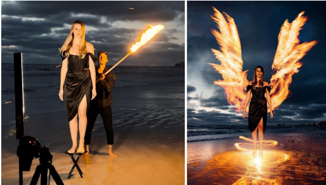
Gambar 3. 3 Long Exposure Photo Trick