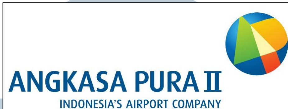
Gambar 2.1 Logo PT Angkasa Pura II (Persero)

Biru adalah warna yang melambangkan pergerakan sektor logistik yang terus tumbuh berkembang pesat. Merah melambangkan tindakan yang berlandaskan semangat kerja dan komitmen PT Angkasa Pura II dalam menyediakan pelayanan berkualitas internasional dengan mengutamakan kenyamanan dan keselamatan pelanggan.