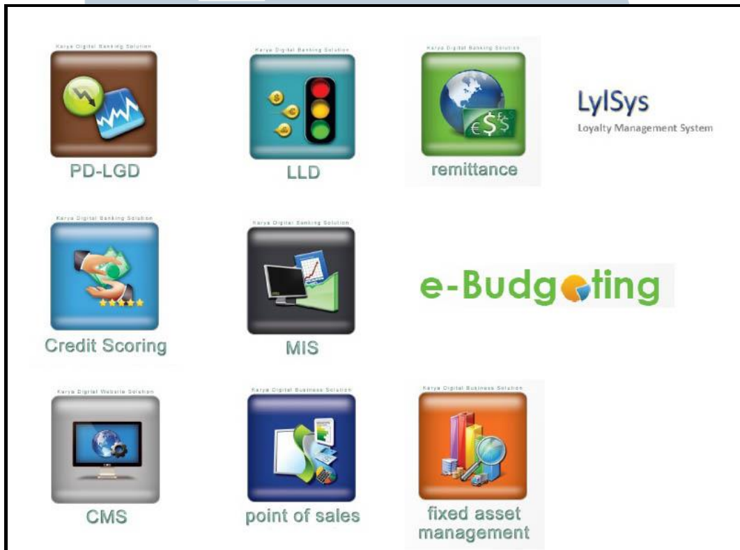
Gambar 2.1 Daftar Aplikasi PT Karya Digital

Selama delapan tahun beroperasi, PT Karya Digital telah bekerjasama dengan lebih dari 20 klien, meliputi perbankan, institusi pemerintah, maupun perusahaan besar dan kecil. Gambar 2.2 menunjukkan beberapa klien dari PT Karya Digital.