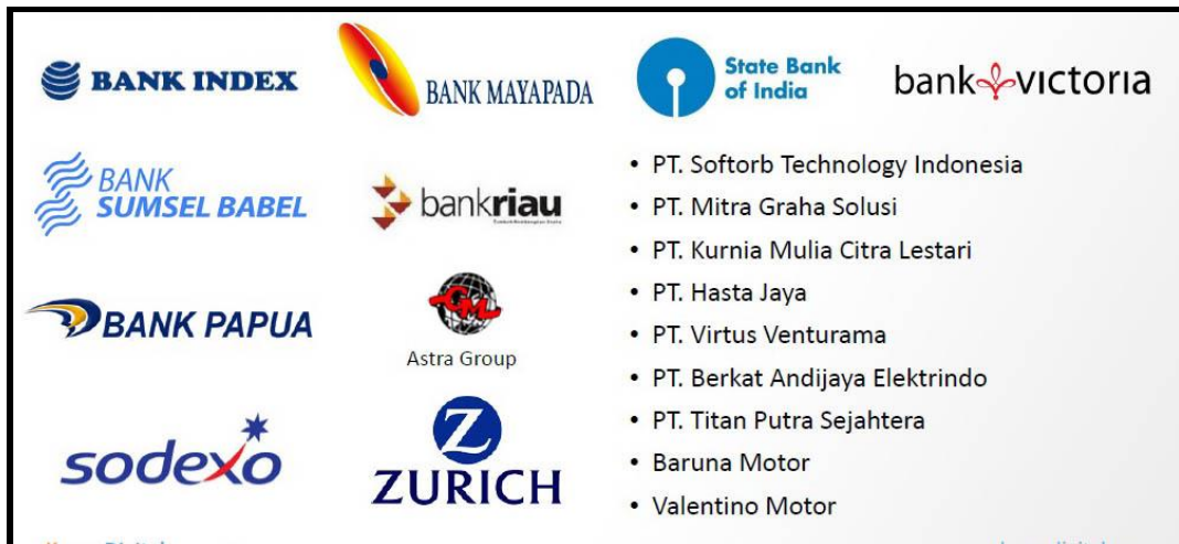
Gambar 2.2 Daftar Klien PT Karya Digital