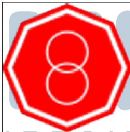
Gambar 2.1 Logo PT Tetsu Sarana Persada

Gambar 2.1 merupakan gambar Logo PT Tetsu Sarana Persada yang didirikan di Jakarta tahun 1982. PT Tetsu Sarana Persada adalah perusahaan yang bergerak di bidang konstruksi baja yang didirikan oleh tiga sekawan. Nama Tetsu Sarana Persada adalah nama kedua dari perusahaan yang sebelumnya bernama PT Baja Sarana. PT Tetsu Sarana Persada sudah berpengalaman dalam membangun berbagai jenis konstruksi baja mulai dari konstruksi untuk pabrik perakitan mobil hingga konstruksi baja stasiun kereta Gambir. PT Tetsu Sarana Persada saat ini telah menjadi perusahaan konstruksi baja yang terkenal di kalangan para pengembang berkat kemampuannya dalam menciptakan struktur rangka baja yang berkualitas dan tahan lama.