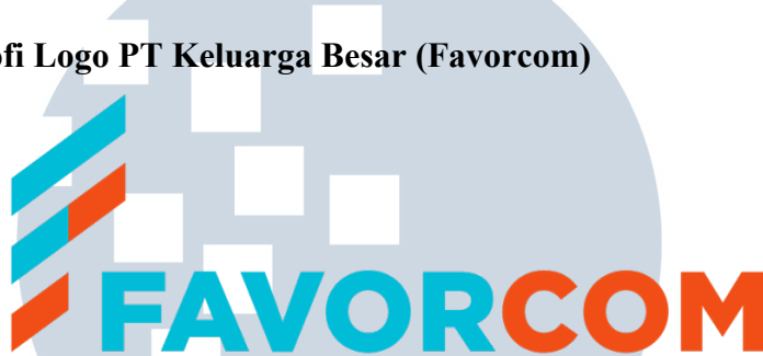
Gambar 2. 1. Logo Perusahaan Favorcom