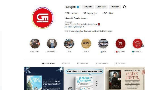
Gambar 2.2. Tampilan Instagram bukugpu