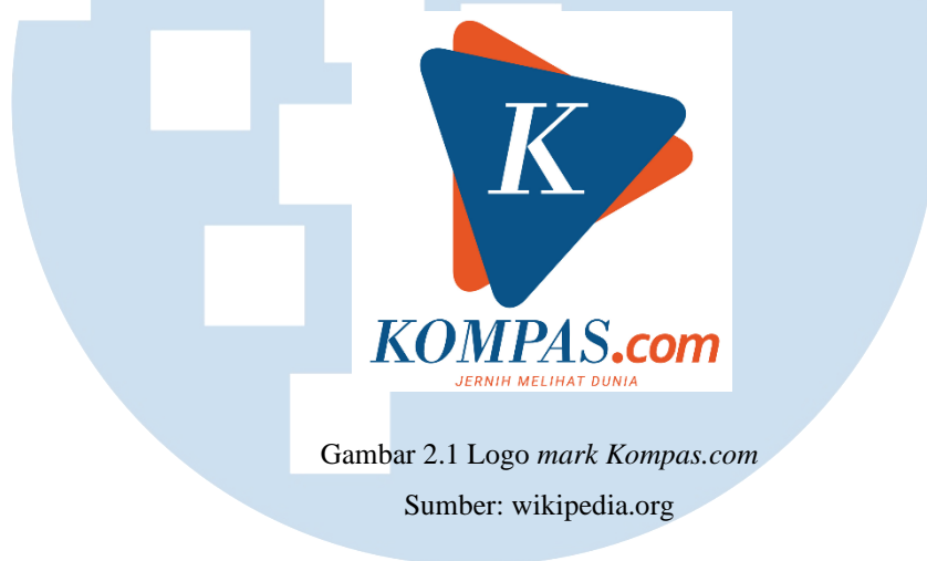
Gambar 2.1 Logo mark Kompas.com