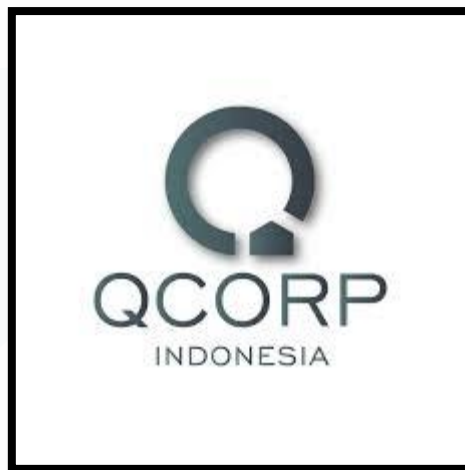
Gambar 2.1 Logo Perusahaan PT Quanta Land Indonesia

PT Quanta Land Indonesia adalah perusahaan yang bergerak di bidang properti dan real estate . Dengan wawasan dan pengalaman di dalam dunia properti selama 30 tahun, menjadi pondasi awal pada perusahaan ini. PT Quanta Land Indonesia didirikan oleh Nicholas Hum dan Denny Asalim pada tahun 2019 yang telah banyak mengembangkan properti di kawasan Asia Pasifik. Dibentuknya perusahaan bertujuan untuk menciptakan peluang dan mengembangkan potensial properti yang ada di Indonesia. Awal masuknya pengembangan properti oleh Nicholas Hum di Indonesia dimulai pada tahun 2017 dengan mengembangkan sebuah proyek bernama Lavon di Tangerang. Saat ini PT Quanta Land Indonesia telah dan sedang mengembangkan beberapa proyek lainnya seperti Duo Residence, Saumata, Wasanta Innopark, Shila, dan Mawatu. Berikut merupakan logo pada PT Quanta Land Indonesia yang dapat dilihat pada Gambar 2.1.