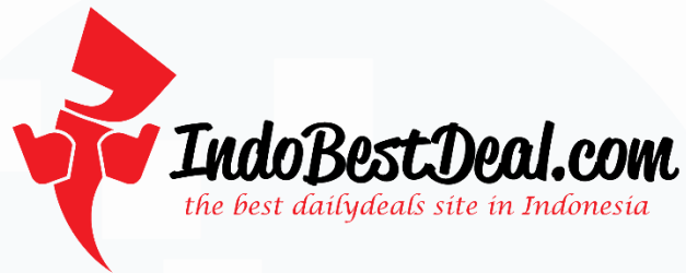
Gambar 2. 2 Logo IndoBestDeal

namun karena kurangnya keuntungan, maka pada akhirnya indobestdeal.com harus ditutup pada tahun 2013.