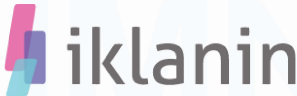
Gambar 2.4 Logo Platform Iklanin

Gambar 2.4 adalah logo dari Iklanin, sebuah platform yang dapat digunakan dari website dari perusahaan Frisidea. Platform tersebut bertujuan untuk memungkinkan pengguna untuk mempromosikan usaha/bisnis mereka. Pada platform tersebut pengguna dapat melihat iklan baris yang tersedia dan membuat iklan. Fitur fitur yang tersedia pada platform tersebut dapat langsung