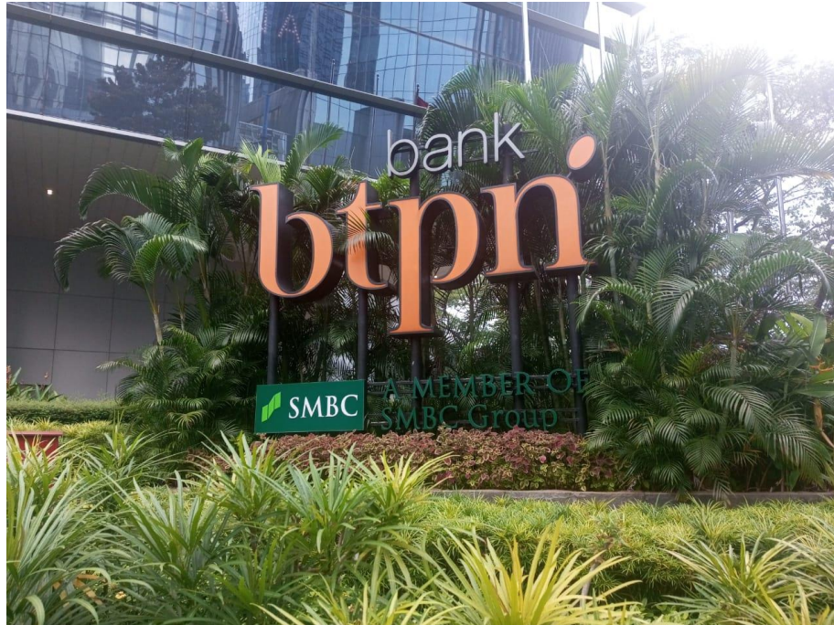
Gambar 2.2 Foto Kantor Bank BTPN

Bank BTPN memiliki visi yaitu menjadikan bank mass market terbaik mengubah hidup berjuta rakyat Indonesia dengan segmen masyarakat berpenghasilan rendah dan segmen usaha mikro kecil. Untuk menjangkau berbagai segmen masyarakat, Bank BTPN memiliki beberapa unit bisnis diantaranya BTPN Sinaya, BTPN Wow!, BTPN Purna Bakti, Jenius, BTPN Mitra Usaha Rakyat, dan BTPN Syariah [8].