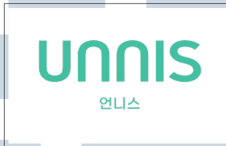
Gambar 2.2. Logo aplikasi UNNIS

mendapatkan kosmetik yang sesuai dengan kebutuhan dan karakteristik konsumen sendiri. Seiring berkembangnya waktu, perusahaan juga mengembangkan sistem AI dalam aplikasi UNNIS, sehingga aplikasi UNNIS dapat menjadi aplikasi rekomendasi produk kecantikan yang komprehensif.