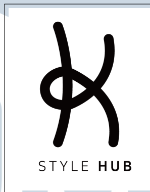
Gambar 2.1. Logo K-Style Hub - PT Keindahan Sejahtera Utama