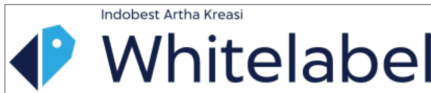
Gambar 2.2. Logo Whitelabel

pelanggan juga dapat menjual dan menjadi reseller dari berbagai macam produk yang tersedia. Hingga saat ini, PT Indobest Artha Kreasi terus berkembang dan menyediakan berbagai layanan seperti Pulsa Massal, Voucherku, IAK API, Bulk Payment , dan lainnya. Gambar 2.2 merupakan logo Whitelabel.