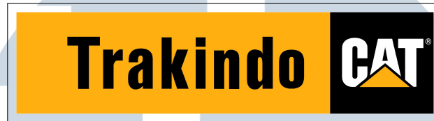
Gambar 2.1. Logo Perusahaan PT. Trakindo Utama