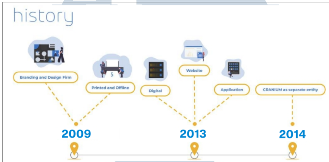
Gambar 2.1. Sejarah singkat PT Cranium Royal Aditama

Pada tahun 2009, PT Cranium Royal Aditama didirikan sebagai bagian dari sebuah agensi yang bergerak di sektor percetakan. Awalnya, perusahaan ini menawarkan layanan percetakan offline dan online, serta menyediakan jasa pembuatan branding dan desain film. Seiring berjalannya waktu, tepatnya pada tahun 2013, PT Cranium Royal Aditama mengambil keputusan untuk beralih dari fokus di bidang percetakan menjadi agensi digital yang menitikberatkan pada bisnis berbasis teknologi.