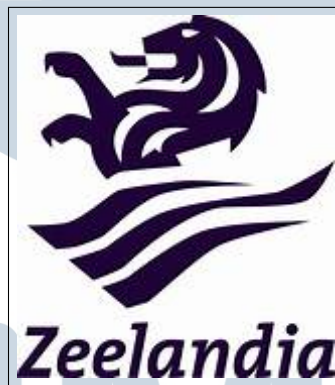
Gambar 2.1. Logo Perusahaan PT. Zeelandia Indonesia

Zeelandia, perusahaan bahan roti yang berasal dari keluarga Doeleman Belanda dan didirikan pada tahun 1900, dengan kantor pusat di Zierikzee, Belanda, telah meraih status pemain global dalam industri bahan roti. Saat ini, Zeelandia memiliki lebih dari 3.200 karyawan di seluruh dunia yang berkomitmen untuk mengembangkan produk bahan roti yang sesuai dengan selera dan kebutuhan lokal. Perusahaan ini beroperasi di lebih dari 30 negara dan produk-produknya tersebar di sekitar 100 negara. Gelar 'Kerajaan' diberikan kepada perusahaan ini oleh Belanda pada tahun 1950. [5]