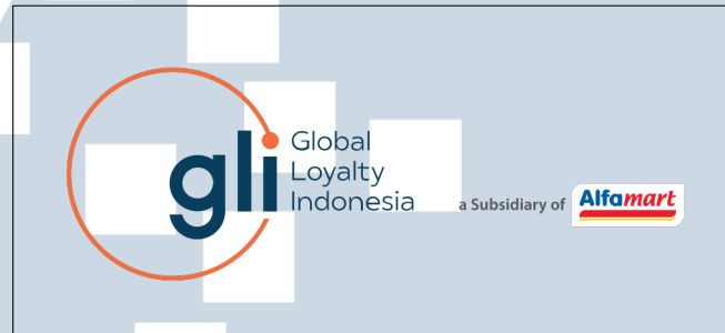
Gambar 2.1. Logo Perusahaan PT Global Loyalty Indonesia

PT Sumber Alfaria Trijaya sebagai perusahaan induk PT Global Loyalty Indonesia didirikan pada tahun 1989 oleh Bapak Djoko Susanto. Perusahaan tersebut memulai aktivitas komersial jual beli aneka produk, terutama pada penjualan rokok [9]. Pada tahun 2002, perusahaan mengakuisisi dan melakukan rebranding pada 141 gerai Alfa Minimart menjadi Alfamart [10]. Pada tahun-tahun setelahnya, Alfamart terus berkembang dengan menambah belasan ribu toko baru untuk menjangkau seluruh Indonesia bahkan ke luar Indonesia. Untuk mengikuti perkembangan teknologi, pada tahun 2019, Alfamart me- launching Aplikasi Alfagift dan mengakuisisi PT Global Loyalty Indonesia untuk mengembangkan layanan digital dan membership Alfamart melalui Aplikasi Alfagift [11]. PT Global Loyalty Indonesia memiliki fokus utama pada analisis data untuk menyediakan solusi yang sesuai untuk pertumbuhan bisnis dan mempertahankan kepercayaan serta kesetiaan pelanggan.