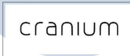
Gambar 2.1. Logo PT Cranium Royal Aditama

PT Cranium Royal Aditama merupakan perusahaan yang bergerak di sektor teknologi yang menyediakan layanan solusi digital bagi pelanggan yang ingin mengembangkan bisnisnya. Cranium berdiri sejak tahun 2009. Pada awalnya, Cranium merupakan agensi brand dan desain serta percetakan. Pada tahun 2013, Cranium memulai bisnis agensi digital berbasis teknologi. Lalu, pada tahun 2014, Cranium menjadi entitas yang berdikari yang menawarkan solusi digital dalam pengembangan bisnis [9]. Lalu, di tahun 2022, 67% saham Cranium diakuisisi oleh perusahaan finansial asal Korea BC Card [10].