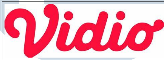
Gambar 2.1. Logo perusahaan PT Vidio Dot Com

Vidio, sebagai platform Over-The-Top (OTT) terkemuka di Indonesia, menyajikan beragam jenis konten, termasuk siaran langsung, berita, hiburan, acara olahraga langsung, dan sinetron. Vidio adalah salah satu entitas di bawah payung Elang Mahkota Teknologi (Emtek) yang berfokus pada media digital dan mempunyai logo seperti pada Gambar 2.1. Para karyawan yang berperan di Vidio dikenal sebagai "Wadiono," singkatan dari Warga Vidio Numero Uno. Sebagai salah satu penyedia layanan OTT terbesar di Indonesia, Vidio menawarkan berbagai saluran siaran langsung, konten asli lokal yang telah meraih berbagai penghargaan, film, dan berbagai konten menarik lainnya [4].