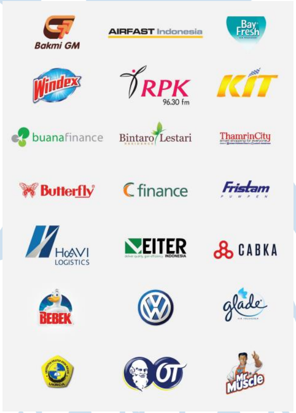
Gambar 2.3 List client Muria Cipta Intermedia

Selama Muria Cipta Intermedia berdiri hingga sekarang, perusahaan telah banyak bekerja sama dengan brand yang telah mempercayakan Muria Cipta Intermedia untuk keperluan branding serta kegiatan promosi yang akan mereka lakukan. Berikut adalah client dari Muria Cipta Intermedia: