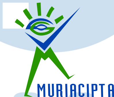
Gambar 2.1 Logo Muria Cipta Intermedia

Muria Cipta Intermedia adalah sebuah creative agency yang bertempat di Rukan Taman Meruya Ilir blok M-74, Jl. Batu Mulia, Meruya Utara, Kec. Kembangan, Kota Jakarta Barat, ID 11620. Dalam Portfolio yang dimiliki oleh Perusahaan, Muria Cipta Intermedia menyediakan layanan dalam branding , seperti Brand Identity yang termasuk pembuatan logo, stationery , marketing tools , dan media yang terkait dengan promosi; Digital Media , yang meliputi pembuatan video , website , video animasi, dan sosial media; Print & Design , yaitu membuat brosur, kalender, packaging , serta company profile .