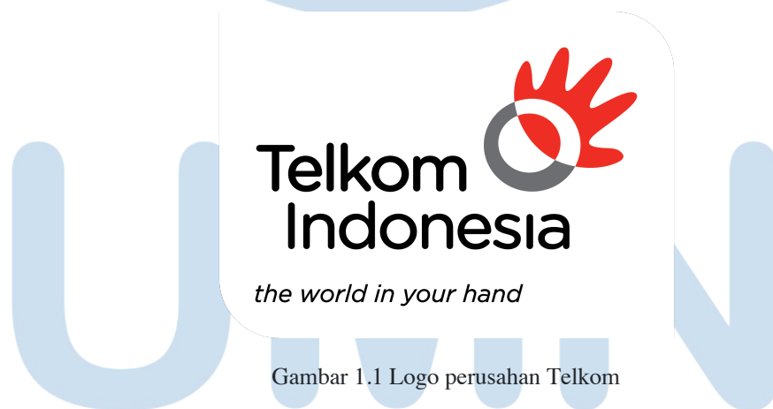
Gambar 1.1 Logo perusahaan Telkom

Telekom Regional VI berada di kota Balikpapan yang berada di jalan JL.Letjen MT Haryono No. 168, Damai, Balikpapan kota, Kalimantan Timur 76114, Indonesia. Telkom Regional VI yang mencakup enam Wilayah Telekomunikasi (Witel) yakni Witel Balikpapan, Witel Kalimantan Barat, Witel Kalimantan Selatan, Witel Kalimantan Utara, Witel Kalimantan Tengah dan Witel Samarinda.