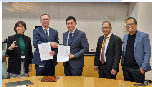
Gambar 2. 2 lkom dan Cisco Jalin Kerjasama Strategis IoT Control Center dan Software Define Network di ASEAN