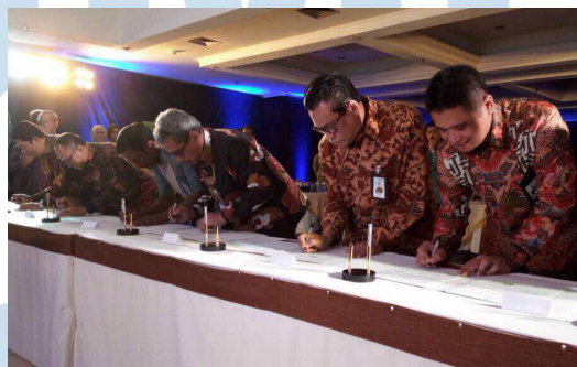
Gambar 2. 6 Kerjasama Telkom dengan BRI dan LKBN Antara: Perkuat Sinergi Core Competence Antar BUMN