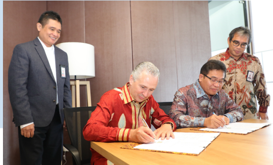
Gambar 2. 4 Telkom dan Telstra Sepakat Menjajaki Kerjasama Pembentukan Global Delivery Center Bidang ICT di Indonesia