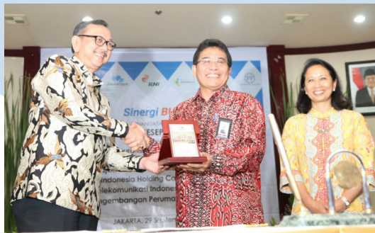
Gambar 2. 5 Kembali Wujudkan Sinergi BUMN, Telkom Jalin Kerjasama dengan Jiwasraya.