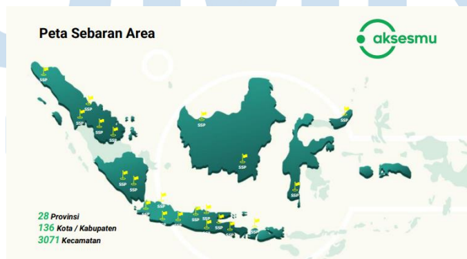
Gambar 2.4 Peta Sebaran Area Aksesmu

Aksesmu sekarang memiliki lebih dari 2.000 karyawan di Head Office dan cabang seluruh Indonesia. Aksesmu berada di 28 provinsi, 136 kota, dan 3017 kecamatan dan memiliki lebih dari 230.000 member OBA ( Outlet Binaan Aksesmu ) di Indonesia.