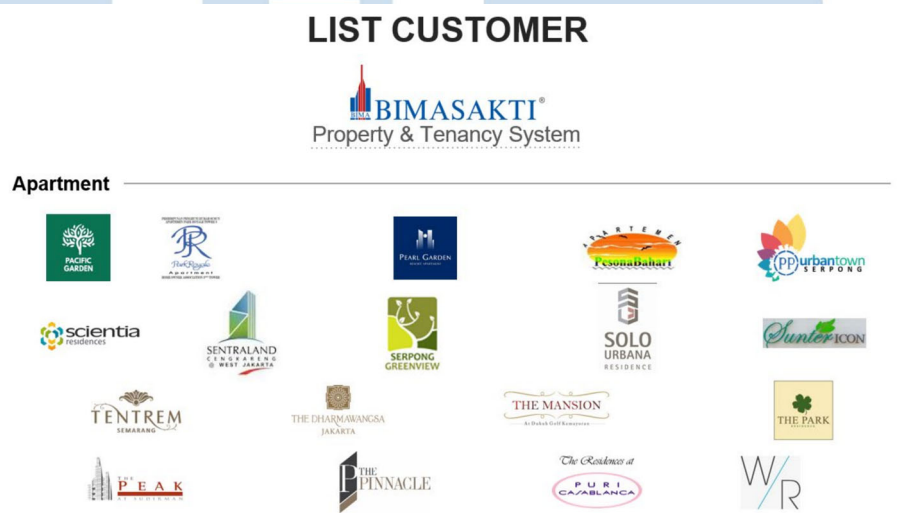
Gambar 2.7 Pelanggan Bimasakti

Bimasakti merupakan sistem yang dirancang khusus untuk pengelolaan properti dan tenant, contohnya seperti apartemen, mall dan berbagai jenis properti lainnya. Sistem ini sendiri digunakan untuk mengelola semua kebutuhan dan menjaga semua fasilitas properti. Berikut beberapa properti yang menggunakan sistem dan jasa Bimasakti, yaitu Pacific Garden, Scientia residences, Puri Casablanca dan masih banyak lagi.