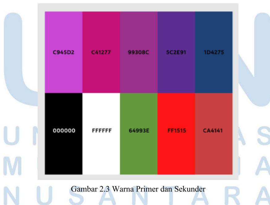
Gambar 2.3 Warna Primer dan Sekunder

Realta juga tentunya menggunakan warna lain untuk membedakan dan mempermudah pelanggan mengidentifikasi berbagai produk software Realta.