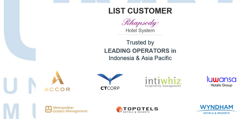
Gambar 2.6 Pelanggan Rhapsody

Dalam memudahkan kegiatan operasional hotel dari berbagai aspek, seperti mengurus tamu, melakukan pengecekan stok barang, dan segala hal yang berkaitan dengan kebutuhan hotel menggunakan Rhapsody untuk meningkatkan efisiensi dalam mengurus hotel. Berikut beberapa nama perusahaan yang bergerak dibidang perhotelan yang telah percaya dan terus menggunakan Rhapsody, yaitu Accor Group, Intiwhiz, Luwansa, CTCorp dan masih banyak lagi.