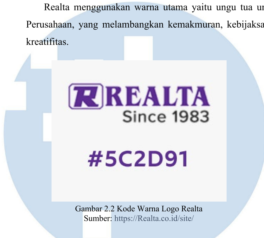
Gambar 2.2 Kode Warna Logo Realta

Realta menggunakan warna utama yaitu ungu tua untuk Logo Perusahaan, yang melambangkan kemakmuran, kebijaksanaan, dan kreatifitas.