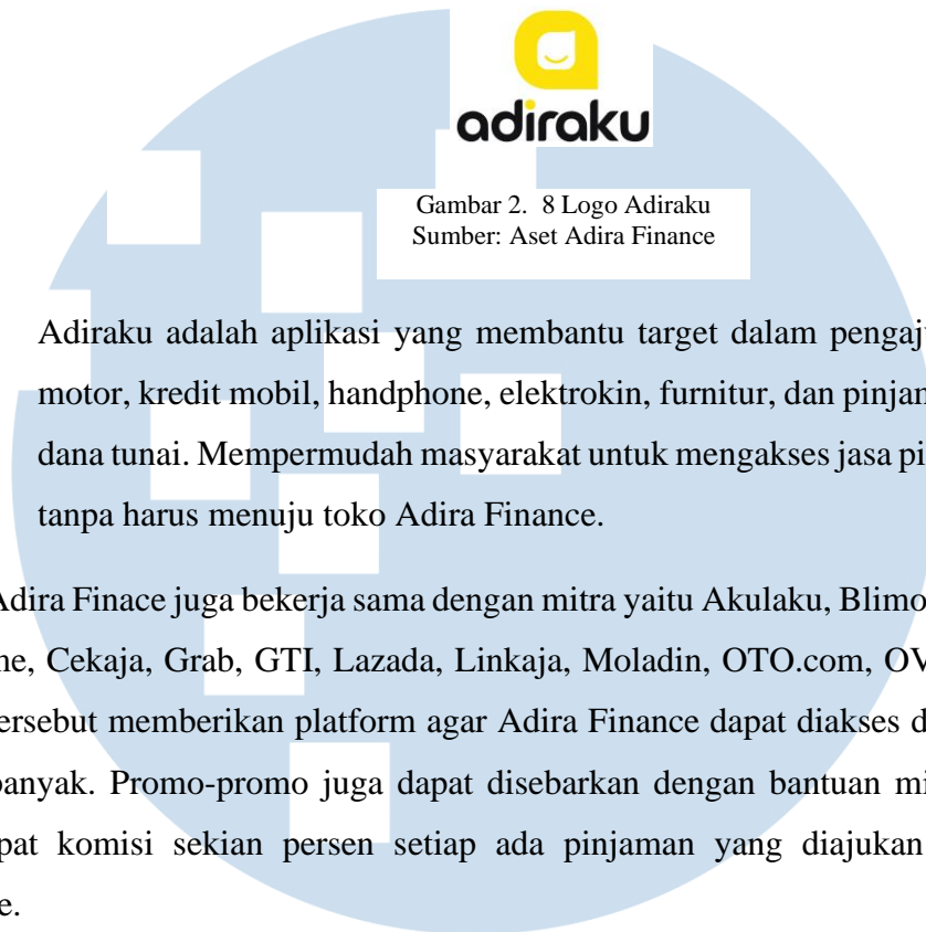
Gambar 2. 8 Logo Adiraku

Adiraku adalah aplikasi yang membantu target dalam pengajuan kredit motor, kredit mobil, handphone, elektrokin, furnitur, dan pinjaman online dana tunai. Mempermudah masyarakat untuk mengakses jasa pinjam dana tanpa harus menuju toko Adira Finance.