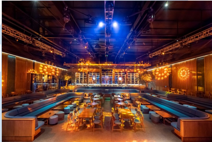
Gambar 2.4 Gold Dragon Palembang

beberapa konsumsi minumannya mengandung alkohol. Dari segi nuansa, Gold Dragon memiliki nuansa yang mewah dan klasik.