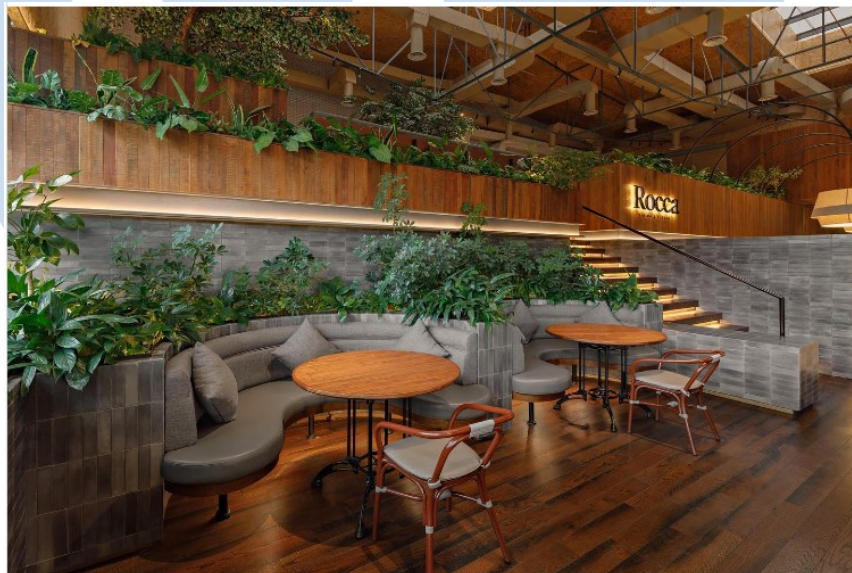
Gambar 2.8 Rocca Dining & Lounge

Rocca adalah sebuah restoran milik HWG yang menggabungkan dua brand lainnya, yaitu Gold Dragon dan Golden Tiger menjadi satu tempat makan yang menyajikan makanan mewah ala Itali. Rocca memiliki nuansa atau tema desain yang memberikan kesan kasual, fresh dan rustic . Rocca merupakan salah satu tempat yang cocok untuk menjadai tempat hangout bersama teman maupun keluarga, sebab Rocca tidak memiliki batasan umur untuk pengunjungnya.