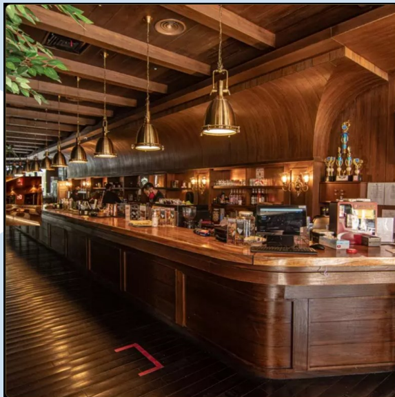
Gambar 2.3 Helen's Epicentrum Jakarta

Helen's adalah brand dari HWG yang memiliki konsep sebuah beer house . Saat ini sudah ada sebanyak 12 outlet Helen's tersebar di seluruh Indonesia. Helen's memiliki inspirasi dari pub Irlandia yang menyajikan live music dengan interior yang memberikan nuansa hangat dan nyaman.