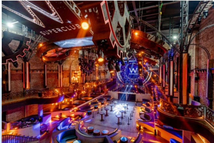
Gambar 2.6 W Superclub Interior