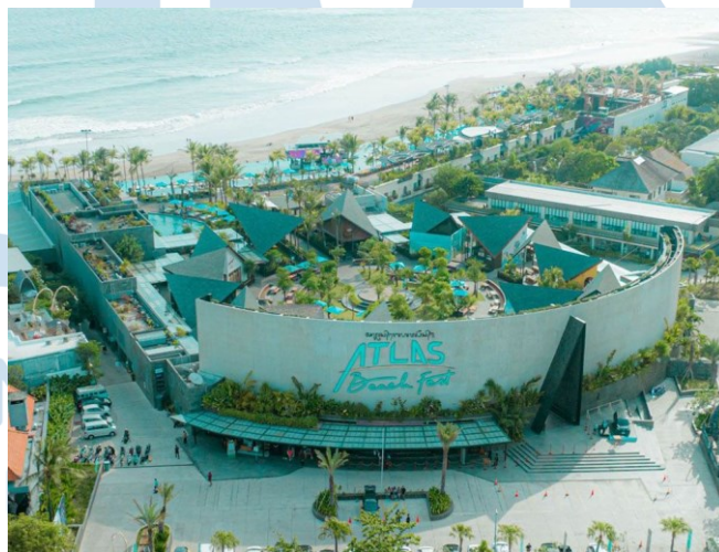
Gambar 2.7 Atlas Beach Club

Atlas Beach Club adalah salah satu destinasi turisme terbesar, yang dimiliki oleh HWG. Atlas Beach Club berlokasi di Pantai Cangu, Bali dan memiliki total luas area sebesar 30.000 m 2 . Di dalamnya, Atlas Beach Club memiliki banyak jenis tempat yang cocok untuk menjadi tempat kunjungan untuk berlibur, seperti clubhouse pantai, nightclub , berbagai tempat kuliner, kolam renang, dan rooftop sunsets .