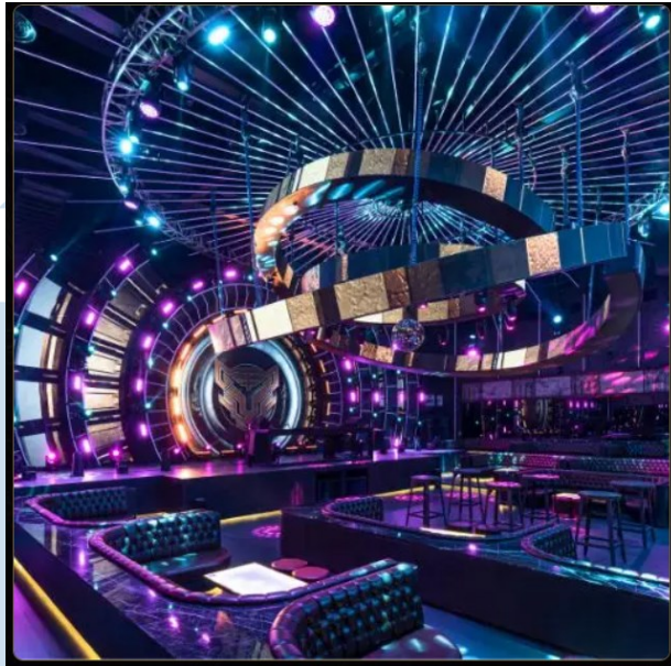
Gambar 2.5 Golden Tiger Kemang, Jakarta