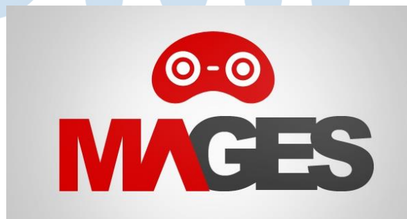
Gambar 2.2 Logo Magesoft

Lion Core Studio digambarkan dengan logo siluet api atau aura berwarna hitam dengan whitespace yang menyerupai kepala singa. Kemudian dibawah logo visual tersebut terdapat nama perusahaan yang menggunakan jenis font sans serif dengan garis tipis dan kaku untuk memberikan kesan elegan. Logo ini merupakan hasil rebrand yang dilakukan pada tahun 2022 dengan mengganti nama dari Magesoft.