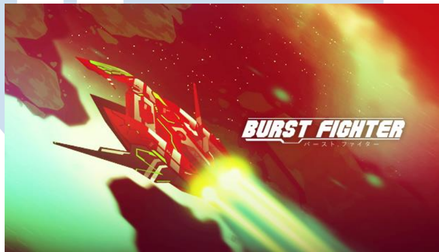
Gambar 2.4 Game Burst Fighter

Burst Fighter merupakan game pertama yang dikembangkan Lion Core Studio dan langkah pertama studio dalam membuat beberapa game lainnya. Game ini merupakan permainan tipe Shoot'em up yang dapat dimainkan melalui komputer. Burst Fighter sendiri menceritakan tentang bangsa zirodia yang sedang melawan penyerbu yang berletak di bumi. Pemain dapat mengkustomisasi pesawat yang digunakan dan dapat bermain bersama teman secara co-op. Burst Fighter ini rilis pada tanggal 16 september 2017 di steam.