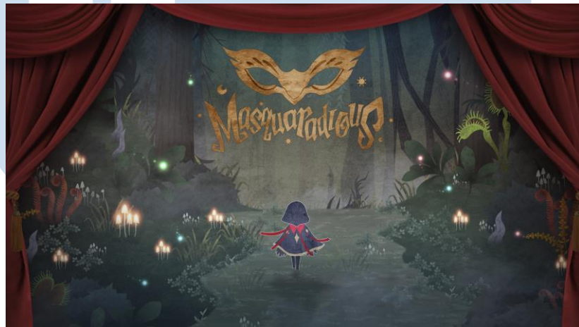
Gambar 2.7 Game Burst Fighter

Masquaradious adalah sebuah game petualangan dengan gaya Roguelike yang berfokus pada story building yang berpusat pada Topeng. Masquaradious memiliki visual unik dibandingkan game lain lainnya karena menggunakan banyak tekstur kertas sehingga memberikan kesan seperti sebuah buku cerita. Pada game ini pemain dapat menggunakan topeng berbeda karena setiap topeng memiliki kekuatan yang unik antar satu sama lain. Masquaradious dapat dimainkan melalui konsol game switch.