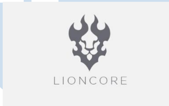
Gambar 2.1 Logo Lion Core Studio

Lion core Studio merupakan studio game indie yang berdiri pada tahun 2017 terletak di Malang. Kemudian pada tahun 2022 melakukan rebranding menjadi Lion Core Studio. Lion Core Studio berfokus pada pembuatan video game stylized yang terinspirasi dari gaya visual animasi jepang.