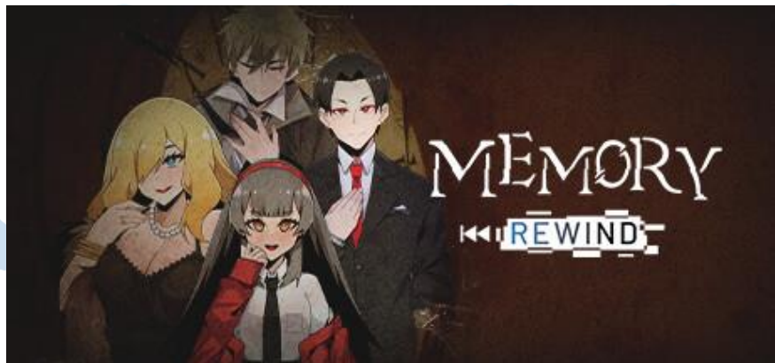
Gambar 2.6 Game Memory Rewind

Memory Rewind merupakan game visual novel yang dihasilkan melalui kolaborasi antara Lion Core Studio dengan Nidji Game Studio. Memory Rewind menceritakan tentang seorang penyelidik pribadi, yang dapat melakukan perjalanan waktu ke masa lalu dan harus menyelesaikan masalah klien yang memiliki kekuatan super melalui gameplay deduksi yang unik. Permainan ini dapat dimainkan melalui komputer/PC dan console .