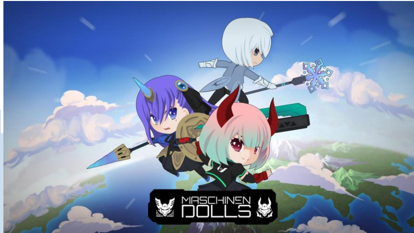
Gambar 2.5 Game Maschine Dolls