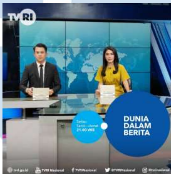
Gambar 2.3 Program Acara Dunia Dalam Berita

Berikut list kerjasama perusahaan TVRI dengan klien-klien dan juga hasil karya/jasa yang telah dibuat oleh perusahaan TVRI selama perusahaan berdiri. Portofolio perusahaan TVRI ini merupakan hasil karya/jasa yang telah dikurasi oleh penulis dan paling mengesankan bagi penulis.