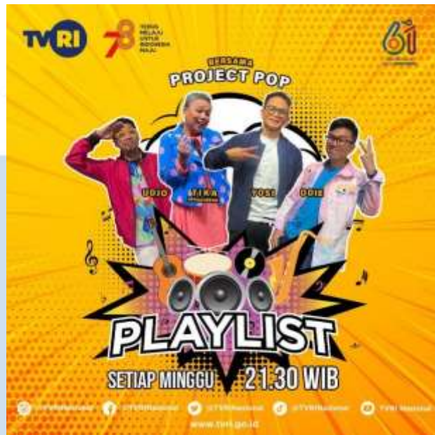
Gambar 2.7 Program Acara Playlist

"Playlist" merupakan salah satu program unggulan TVRI yang mengundang sejumlah artis dan penyanyi terkemuka Indonesia untuk menggali berbagai aspek menarik di dunia musik. Acara ini menghibur pemirsa setiap hari Minggu pada malam hari, memberikan wawasan mendalam tentang keberagaman genre musik yang populer di Tanah Air. Pembicaraan tidak hanya terbatas pada satu jenis musik, melainkan mencakup seluruh spektrum genre yang ada di Indonesia. Tak hanya menjadi ajang wawancara, "Playlist" juga menampilkan pembawa acara khusus dari band ternama, yakni "Project Pop".