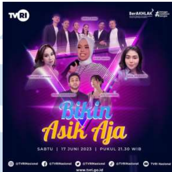
Gambar 2.6 Program Acara Bikin Asik Aja

Program "Bikin Asik Aja" adalah salah satu acara yang diselenggarakan oleh TVRI, yang mengundang berbagai artis, tokoh, dan pembicara terkemuka dari Indonesia untuk berbincang dan berdiskusi mengenai berbagai topik menarik. Materi pembicaraan dalam acara ini sangat bervariasi, disesuaikan dengan latar belakang dan keahlian pembicara yang diundang. Setiap undangan kepada para pembicara bukan hanya bertujuan untuk menghibur, tetapi juga memberikan wawasan yang mendalam kepada pemirsa. Berbagai sudut pandang dan pandangan unik diperkenalkan, menciptakan suasana diskusi yang merangsang pemikiran. Dengan "Bikin Asik Aja," TVRI tidak hanya memberikan hiburan berkualitas, tetapi juga merangkul perbedaan dan merayakan kekayaan intelektual Indonesia. Acara ini menjadi panggung di mana berbagai pemikiran dan ide berkumpul, menciptakan ruang untuk inspirasi dan pemahaman yang lebih dalam tentang keberagaman dan dinamika masyarakat.