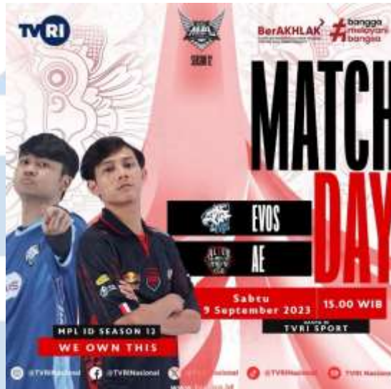
Gambar 2.5 Program Acara TVRI dengan E-sport Mobile Legend

Program acara TVRI Sport merupakan program TVRI yang sering menayangkan turnamen khususnya pada klasemen Mobile Legend . Gim Mobile Legend termasuk kedalam program acara olahraga di TVRI dikarenakan gim tersebut cukup menarik banyak audiens khususnya audiens muda. Pada program acara ini, TVRI menjadi penyiar resmi untuk turnamen MPL ( Mobile Legend: Bang Bang Professional League ) semenjak musim turnamen ke-11. Program ini dapat ditonton secara langsung pada stasiun televisi TVRI di jam-jam tertentu.