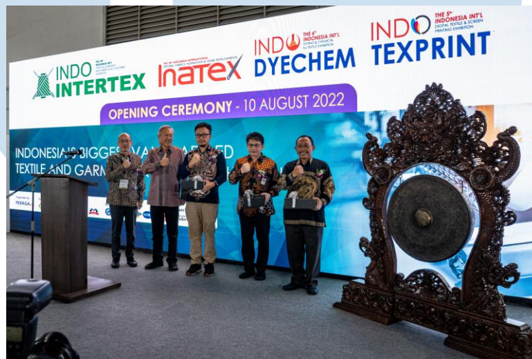
Gambar 2.3 INDO INTERTEX-INATEX 2022

menampilkan dan menjual berbagai produk yang mencakup mesin tekstil, mesin pakaian, produk tekstil, printing, dan bahan kimia pewarna. Selain pameran produk, acara ini juga melibatkan berbagai kegiatan seperti business matching , program seminar, galeri tren produk, dan sesi jaringan bisnis. Hal ini menciptakan platform komprehensif yang tidak hanya menampilkan produk-produk terkini dalam industri, tetapi juga mendukung pertukaran pengetahuan, kolaborasi bisnis, dan pemahaman mendalam terhadap tren dan inovasi terkini di sektor tekstil dan produksi pakaian.