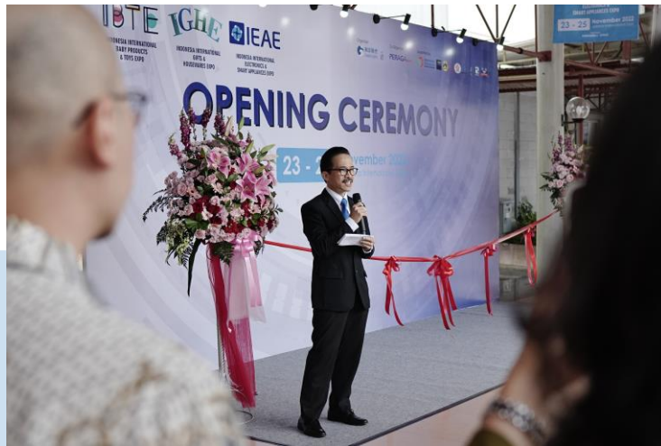
Gambar 2.4 China Trade Expo 2022