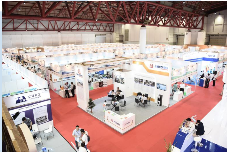
Gambar 2.5 Indonesia Industrial Machinery and Electronic Product 2019

seminar, galeri tren produk, dan sesi jaringan bisnis. Ini menciptakan kesempatan bagi para peserta untuk menjelajahi inovasi terkini, menjalin hubungan bisnis, dan memperluas wawasan industri melalui berbagai kegiatan pendukung yang diselenggarakan.