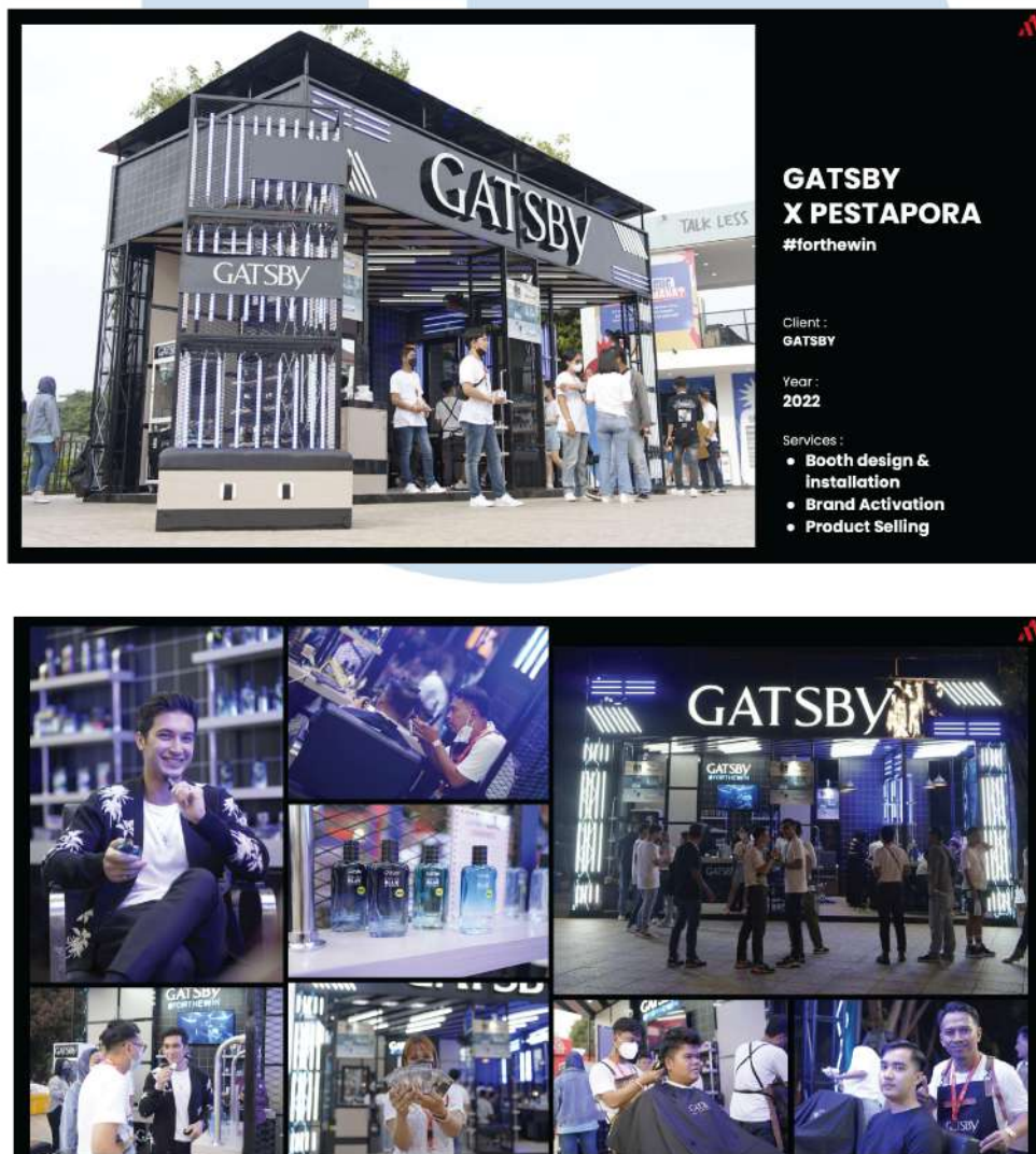
Gambar 2. 5 Booth Gatsby Pestapora 2022

Pada akhir tahun 2022 PT Argo Kreasi Pratama bekerja sama dengan Gatsby untuk membuat Booth pada acara Pestapora 2022 yang berlokasi di JIEXPO Kemayoran. PT Argo Kreasi Pratama mampu memenuhi segala kebutuhan yang diperlukan Gatsby seperti, desain visual, desain Booth , konten acara dan lainnya.