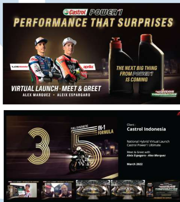
Gambar 2. 4 Lauching Produk Castrol

Selain produk dari Mayora Grup, PT Argo Kreasi Pratama juga menjalin kerja sama dengan Castrol. Castrol merupakan brand oli untuk kendaraan pribadi seperti motor dan mobil, dari berbagai macam kendaraan bermotor produk oli yang dimiliki tidak hanya satu, melainkan banyak produk. Salahsatu produk yang akan dirilis adalah Castrol Magnatec Oil, Castrol bekerja sama untuk merilis produk baru ini bersama PT Argo Kreasi Pratama. PT Argo Kreasi Pratama mendukung segala keperluan yang dibutuhkan Castrol untuk merilis produk barunya secara daring. Kebutuhan yang diperlukan yaitu konten, design background, desain produk, dan banyak lainnya.