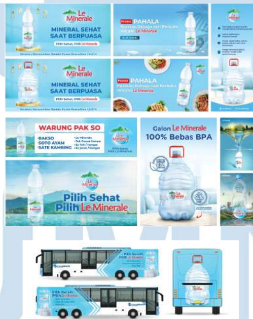
Gambar 2. 3 Promosi digital Le Mineral

Mayora Group memiliki beberapa produk yang salah satu produknya bekerja sama dengan PT Argo Kreasi Pratama yaitu Le Mineral. Sebagai salah satu produk unggulan, Le Mineral harus memiliki Brand Awareness untuk meningkatkan unique Selling Point (USP) terhadap pasar yang lebih luas. Oleh karena itu PT Argo Kreasi Pratama Hadir untuk memenuhi kebutuhan promosi yang berupa konten, desain, produksi, brand Activation , Unique Selling Point , dan lainnya. Ada beberapa acara yang di lakukan oleh PT Argo Kreasi Pratama bersama Le Mineral yaitu, konten acara ramadhan bersama Le Mineral, Brand Activation Le Mineral untuk setiap warung dan Branding Le Mineral untuk kebutuhan promosi.