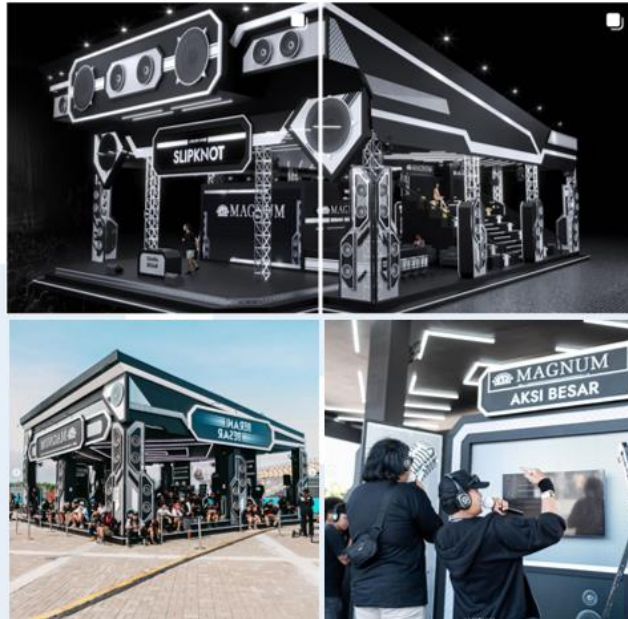
Gambar 2. 4 Booth Magnumotion di Event Hammersonic