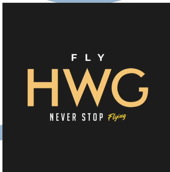
Gambar 2. 1 Logo Perusahaan HWG

Didirikan pada tahun 2014 oleh PT Aneka Bintang Gading atas inisiatif dari pengusaha Eka Satria Wijaya dan Ivan Tanjaya, perusahaan ini awalnya dimulai dengan restoran bernama "Kedai Opa". Seiring berjalannya waktu, restoran ini berkembang dan berganti nama menjadi "Holywings," yang kini menjadi tempat tongkrongan kelas atas. HWG, yang juga dikenal sebagai Holywings, merupakan perusahaan yang aktif di sektor hiburan dan gaya hidup yang sangat diminati oleh generasi milenial (Ratriani, 2022). HWG memiliki beragam jenis usaha, termasuk restoran, bar lounge, klub, dan berbagai jenis acara. Pada bulan Mei 2021, HWG mendapatkan dukungan dari tokoh terkenal Hotman Paris dan Nikita Mirzani, yang bukan hanya berperan sebagai investor tetapi juga sebagai pengacara perusahaan HWG. Data tersebut diambil dari situs resmi perusahaan.