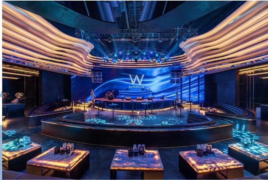
Gambar 2. 8 W Superclub