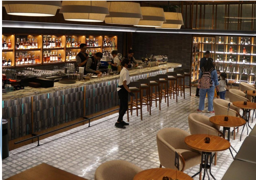
Gambar 2. 10 Rocca