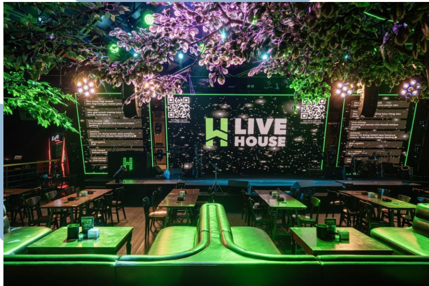
Gambar 2. 4 HW Live House

HW Livehouse adalah sebuah tempat yang menjadi pusat bagi para pecinta musik dengan anggaran terbatas. Di sini, pengunjung dapat menikmati konser musik setiap hari yang dipersembahkan oleh Livehouse Stars dan kadang-kadang ada penampilan kejutan dari artis populer. HW Livehouse menyediakan platform untuk pertunjukan musik live dan hiburan bagi masyarakat yang ingin menikmati musik secara langsung dengan harga yang terjangkau. Tempat ini memberikan pengalaman berharga bagi para penggemar musik yang ingin merasakan konser secara rutin tanpa harus mengeluarkan biaya yang besar.