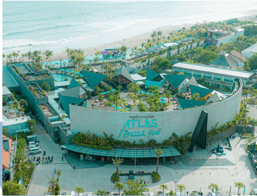
Gambar 2. 9 Atlas Beach Club