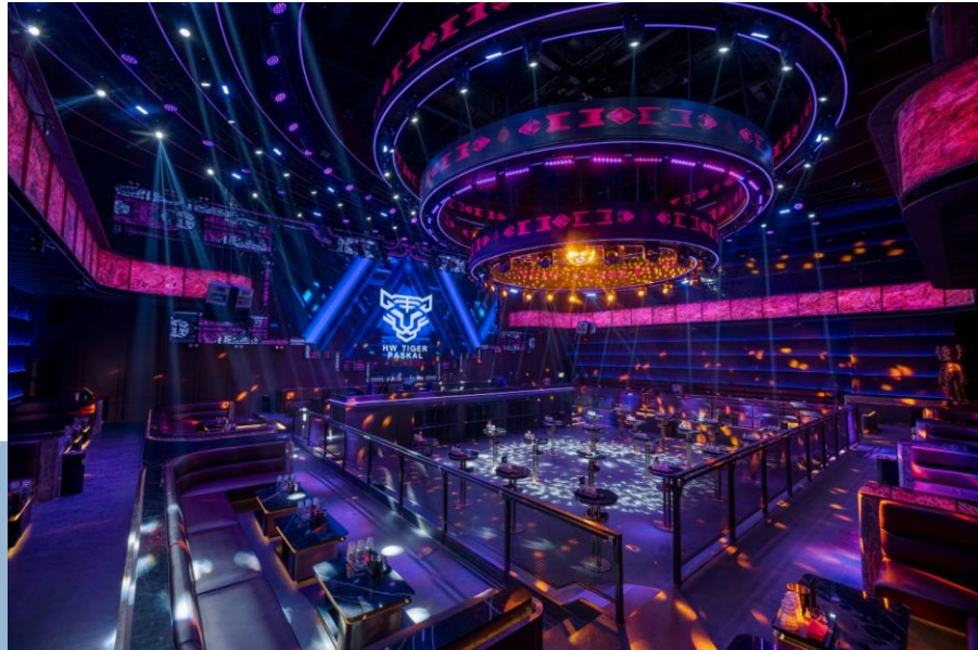
Gambar 2. 7 Golden Tiger