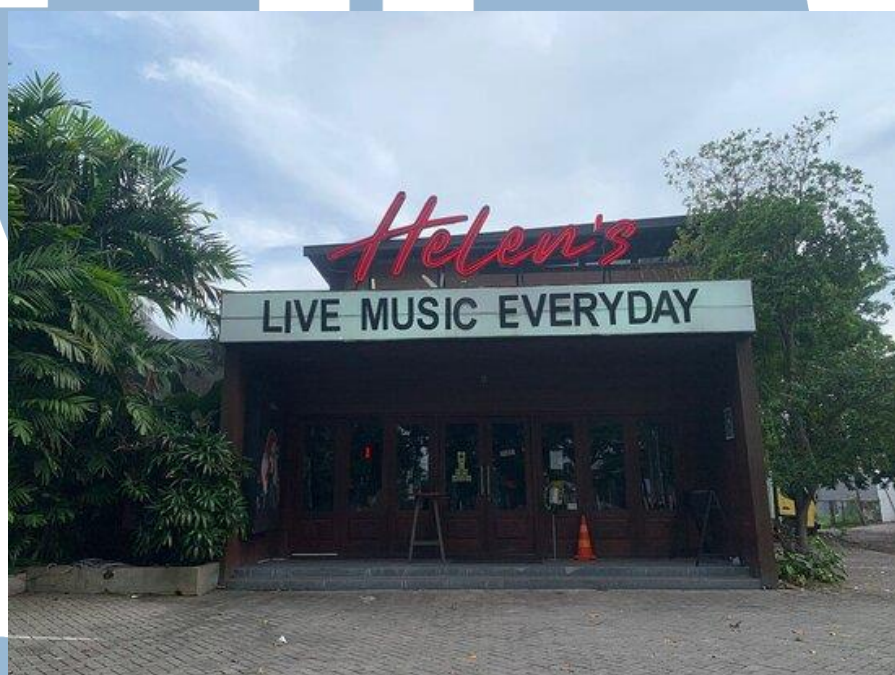
Gambar 2. 5 Helen's

Saat ini, Helens Beer House telah berhasil membuka 12 outlet di berbagai lokasi di Indonesia. Konsep Helens Beer House terinspirasi oleh pub-pub di Irlandia yang menyajikan suasana bar yang disertai dengan pertunjukan musik live klasik. Helens Beer House menawarkan nuansa yang mengusung tema bar kecil yang sangat diminati oleh kalangan muda, tetapi tetap ramah untuk berbagai kelompok usia. Tempat ini menjadi favorit bagi anak-anak muda dan dapat dinikmati oleh berbagai kalangan.