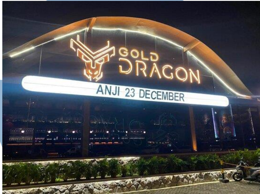
Gambar 2. 6 Gold Dragon

Gold Dragon memiliki sebanyak 13 outlet yang tersebar di berbagai lokasi di seluruh Indonesia.