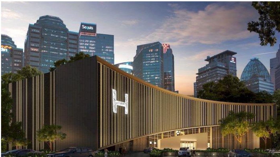
Gambar 2.3 The H Club

The H Club adalah sebuah kelab malam ter-elit dan terbesar di Asia yang baru dibuka di SCBD pada tanggal 28 April 2023. Kelab malam ini diklaim sebagai salah satu kelab malam terbaik di Asia. The H Club merupakan bagian dari HW Group, sebuah perusahaan yang berfokus pada bisnis di bidang lifestyle dan hiburan. The H Club menjadi salah satu dari banyak klub yang dimiliki oleh HWG, dan kelab malam ini memiliki reputasi sebagai salah satu destinasi hiburan terkemuka di wilayah tersebut. Dengan suasana yang eksklusif dan berbagai jenis hiburan yang ditawarkan, H Club menarik perhatian pengunjung yang mencari pengalaman malam yang unik dan berkualitas. H Club adalah sebuah kelab malam bergengsi yang merupakan bagian dari portofolio hiburan yang sukses dari Holywings Group di Indonesia.