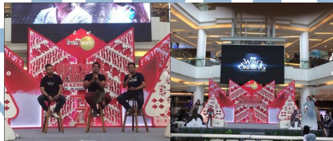
Gambar 2.4 Acara “Pentas Ksatria Nusa” Sumber: Instagram Kurva DIGITAL DRAWING

Kurva Digital Drawing Course juga mengadakan digital drawing competition , workshop dan talkshow di Living World dengan tema “Pentas Ksatria Nusa” pada tahun 2018. Pada acara ini, Kurva Digital Drawing Course bekerjasama dengan Wacom, Grand Tech, BIC, Ciayo Comics, Nomad, Bumi Kardus, Denda Music, dan Kid Publish. Perusahaan ini juga berkesempatan untuk mengundang salah satu pemeran dari Wiro Sableng untuk hadir pada acara tersebut.