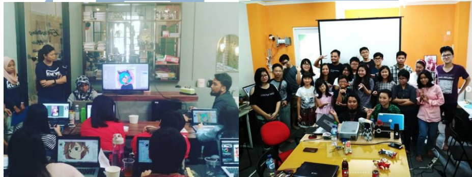
Gambar 2.5 Beberapa contoh workshop dan lomba yang pernah dilakukan

Agar para siswa-siswi di Kurva Digital Drawing Course dapat lebih berkembang dalam segi teknik dan skill , Kurva Digital Drawing Course juga mengadakan workshop dan lomba secara berkala dengan tema yang sudah disesuaikan setiap lombanya dan workshop .