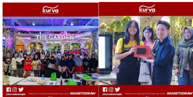
Gambar 2.6 Lomba secara realtime dan online pertama di Indonesia Sumber: Instagram Kurva DIGITAL DRAWING

Kurva Digital Drawing Course bekerjasama dengan Wacom dan Grand Tech untuk mengadakan lomba gambar digital secara online dan realtime pertama di Indonesia.