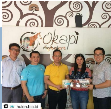
Gambar 2.3 Kerjasama antara Kurva dan Huion

Kurva Digital Drawing Course mendapatkan pengakuan “The Best Digital Drawing Curriculum for Kids” dari Wacom pada tahun 2011 karena kurikulumnya yang sangat sesuai untuk anak-anak yang ingin belajar digital drawing .