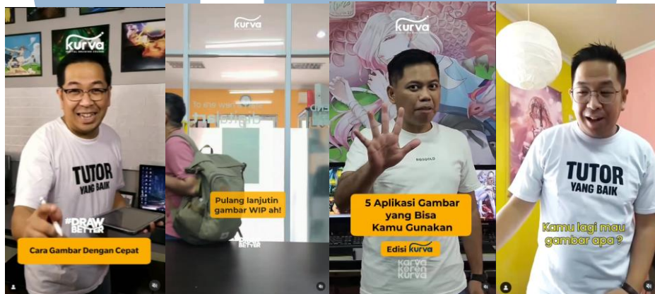
Gambar 2.8 Contoh video di Instagram Kurva Digital Drawing Course