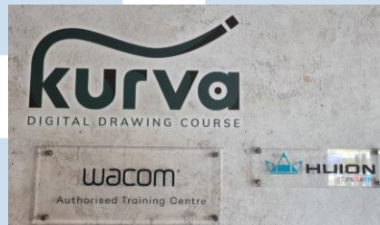
Gambar 2.2 Pengakuan untuk Kurva dari Wacom dan Huion

mendapatkan pengakuan “The Best Digital Drawing Curriculum for Kids” dari Wacom Southeast Asia pada tahun 2011 dan pengakuan sebagai “Wacom Authorised Training Center” dan “Huion Sole Educator” pada tahun 2018.