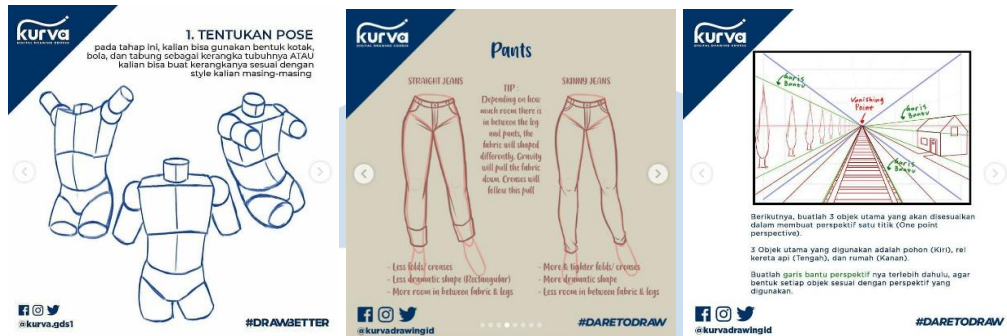
Gambar 2.8 Contoh Tips and Tricks oleh Kurva Digital Drawing Course