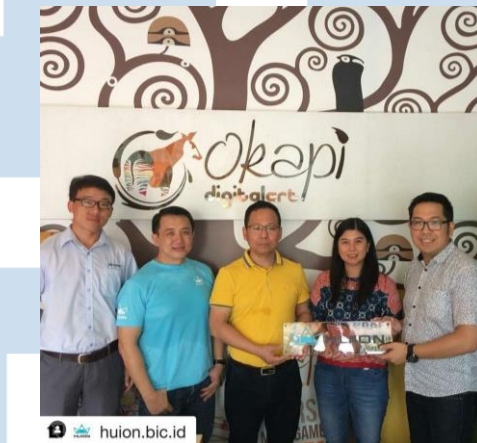
Gambar 2.4 Kerjasama antara Kurva dan Huion

2011, Kurva Digital Drawing Course mendapatkan pengakuan “The Best Digital Drawing Curriculum for Kids” dari Wacom karena kurikulumnya yang baik untuk anak-anak, dan dengan seiring waktu, Kurva bekerjasama dengan Wacom dan Huion untuk meningkatkan jasa pelatihan yang mereka berikan.