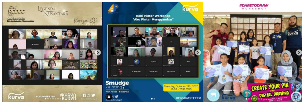
Gambar 2.6 Beberapa contoh workshop dan lomba yang pernah dilakukan

Selain mengadakan secara offline , Kurva Digital Drawing Course juga menjadi yang pertama dalam mengadakan lomba gambar digital secara realtime dan online di Indonesia. Pada acara ini, Kurva Digital Drawing Course bekerjasama dengan Wacom dan Grand Tech.