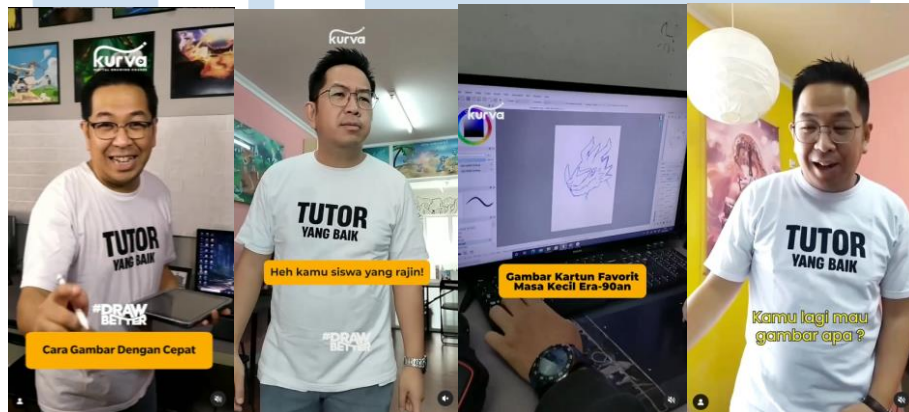
Gambar 2.9 Contoh posting video di Instagram Kurva Digital Drawing Course