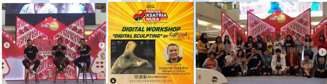
Gambar 2.5 Acara “Pentas Ksatria Nusa”

Pada tahun 2018, Kurva juga mengadakan digital drawing competition , workshop dan talkshow di Living World dengan tema “Pentas Ksatria Nusa”. Pada acara ini, Kurva bekerjasama dengan Wacom, Grand Tech, BIC, Ciayo Comics, Nomad, Bumi Kardus, Denda Music, dan Kid Publish. Acara ini juga mendatangkan cast dari Wiro Sableng.