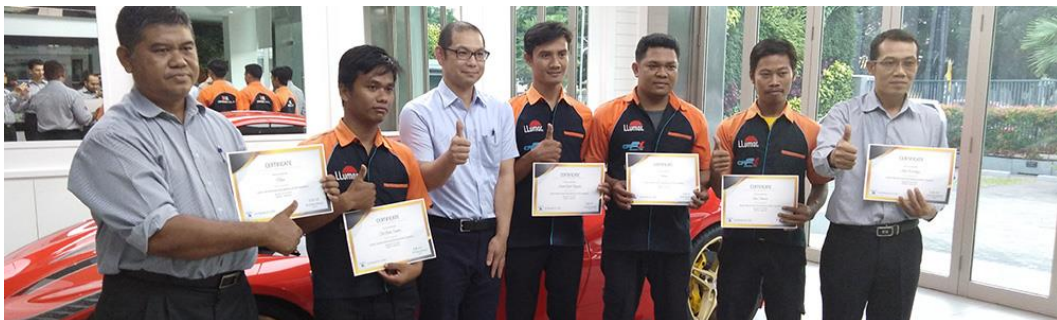
Gambar 2.9 Penghargaan MUI (2018)

Paint protection film dari Uniglobe mendapatkan rekor MURI (Museum Rekor Indonesia) sebagai antigores/PPF pertama yang tahan 7x24 jam terhadap gesekan.