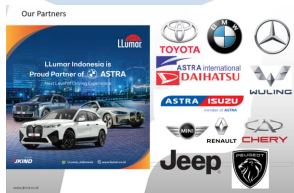
Gambar 2.7 Brand-brand kerjasama

PT. Jaya Kreasi Indonesia memiliki hubungan kerja sama dengan brand-brand besar seperti Astra BMW, Honda, Astra International Daihatsu, Toyota, Mercedes Benz, Wuling, Astra Isuzu, Mini Cooper, Renault, Jeep, Chery, dan Peugeot. Semua brand diatas mempercayakan produknya kepada PT. Jaya Kreasi Indonesia.