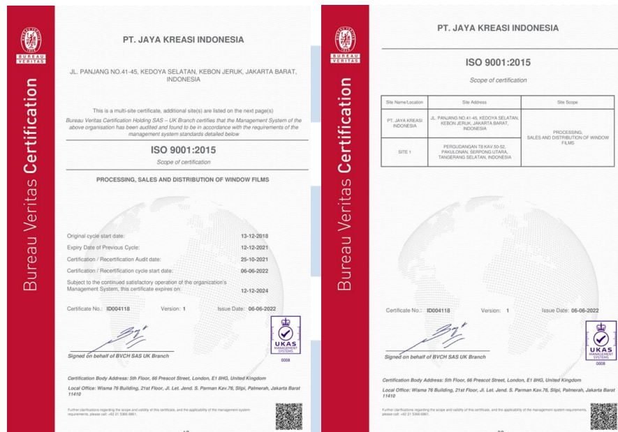
Gambar 2.8 ISO 9001:2015